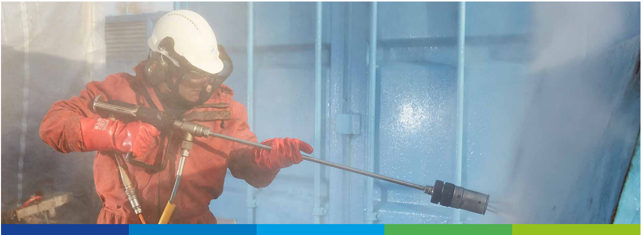
Strahlen einer Oberfläche zur Vorbereitung zum Aufbringen von Oberflächenschutz