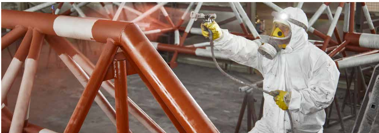
Aufbringen von Oberflächenschutz

Vom Krieg in der Ukraine und den dadurch ausgelösten Folgewirkungen und wirtschaftlichen Risiken abgesehen liegen keine wesentlichen Änderungen der Chancen und Risiken im Vergleich zum Geschäftsjahr 2021 vor. Wir verweisen deshalb auf die ausführlichen Erläuterungen im Geschäftsbericht 2021.