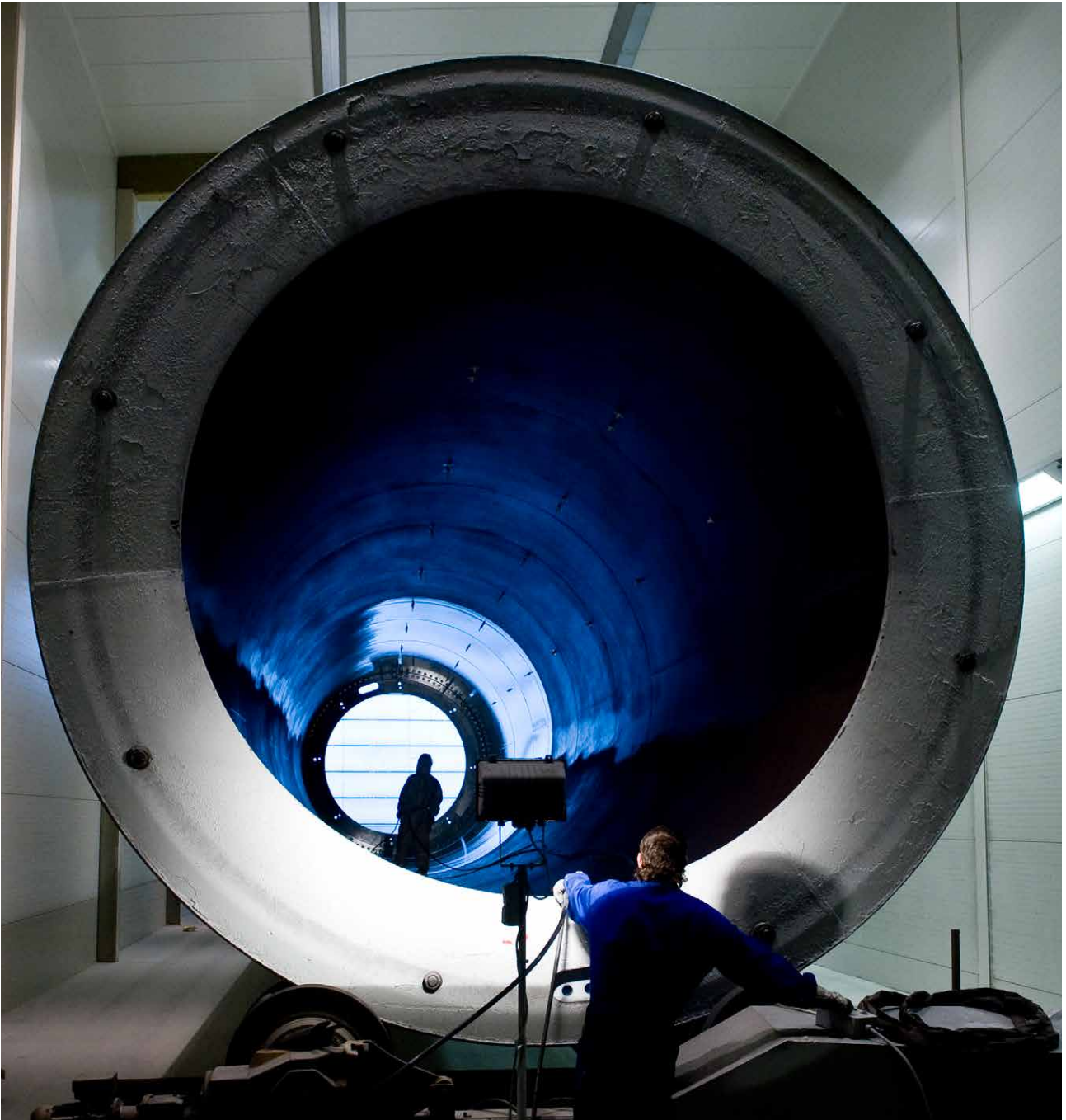
Beschichtungsarbeiten an einem Windturbinenturm